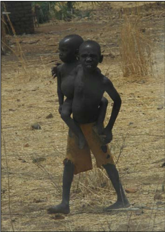
Die Kinder leiden am meisten an den Folgen des Krieges und sind oft sich selbst überlassen.

unter den unsicheren und gefährlichen Verhältnissen des Krieges. Oft sind sie auf sich alleine gestellt, besonders wenn es darum geht, eine Schule oder Schulgeld zu finden.