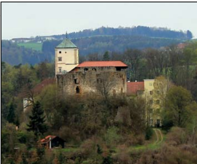
Schloss Riedegg in der Gemeinde Alberndorf in der Riedmark.

Offenes Haus. Zurzeit leben acht Marianhiller Missionare im Schloss und die Missionsschwester vom Kostbaren Blut als Hausmutter. Das Durchschnittsalter